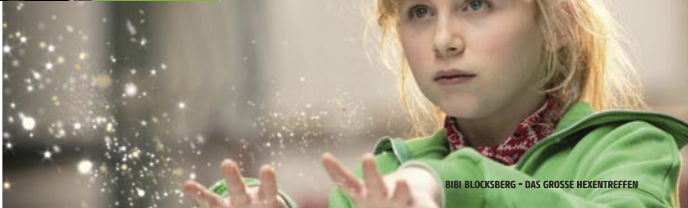
BIBI BLOCKSBERG - DAS GROSSE HEXENTREFFEN