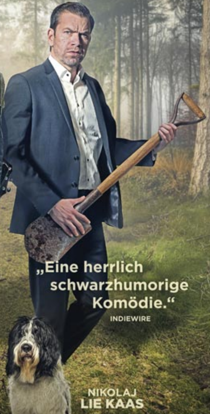
NIKOLAJ LIE KAAS

„Eine herrlich schwarzhumorige Komödie.“